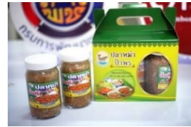
ภาพที่ 3 ผลิตภัณฑ์ปลาหมึกของชุมชน

“ปลาหมึกที่ดี ต้องใช้ปลาช่อน หรือ ปลาชะโด และจะต้องเป็นปลาสดเท่านั้น ล้างทำความสะอาดให้ดี ข้าวคั่วที่ใช้ควรเป็นข้าวคั่วใหม่จะมีกลิ่นหอม ปลาสดเมื่อเริ่มต้นการทำให้ขอดเกล็ดและล้างออกให้หมด ล้างให้หมดควาและหมดเมือก หมักกับเกลือเม็ดในปริมาณที่มาก คือในอัตราส่วน เนื้อปลา 10 กิโลกรัม ต่อเกลือเม็ด 1 กิโลกรัม การใช้เกลือในปริมาณที่มากเพื่อป้องกันไม่ให้ปลาเน่าหมัก แยกกันไปตามชนิดและขนาดของปลา เมื่อหมักปลาได้ระยะเวลา 4-5 เดือน ก็นำปลามาล้าง พักให้สะเด็ดน้ำ 1 คืน หั่นเนื้อปลาเป็นชิ้นบาง ๆ ขนาดประมาณ 1-1.5 เซนติเมตร ใส่ข้าวคั่วเคล้าให้เข้ากัน การใส่ข้าวคั่วเพื่อให้เนื้อปลาไม่ติดกันและทำให้หอม หมักต่อเป็นเวลา 2 เดือน จึงนำมาใส่เนื้อสับประรดเพื่อให้เนื้อปลานุ่ม และลดความเค็ม รสชาติที่ได้ก็จะมีความกลมกล่อม จึงสามารถรับประทานและจำหน่ายได้ ส่วนมากก็ขายในบ้านบ้าง ตามงาน OTOP บ้าง ในบางครั้งร้านอาหารต่าง ๆ มารับซื้อไปทำอาหารขายที่ร้าน หรือ ขายในออนไลน์ก็มี” นางสมัย เกิดอยู่ (ผู้ให้สัมภาษณ์)