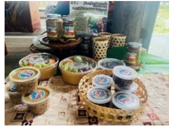
ภาพที่ 4 ผลิตภัณฑ์ปลาหมึกของชุมชน จำหน่าย ณ สุ่มปลายักษ์ วัดทองประดิษฐ์ อ.สองพี่น้อง สุพรรณบุรี